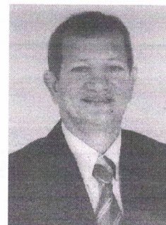
Digital não cadastrada.