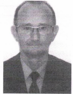
Digital não cadastrada.