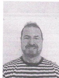
Digital não cadastrada.