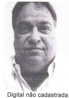
Digital não cadastrada.