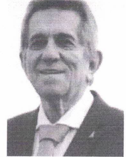
Digital não cadastrada.